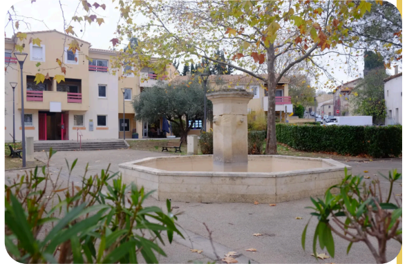
Le haut de la place fera l'objet d'aménagements légers, pour décloisonner l'espace